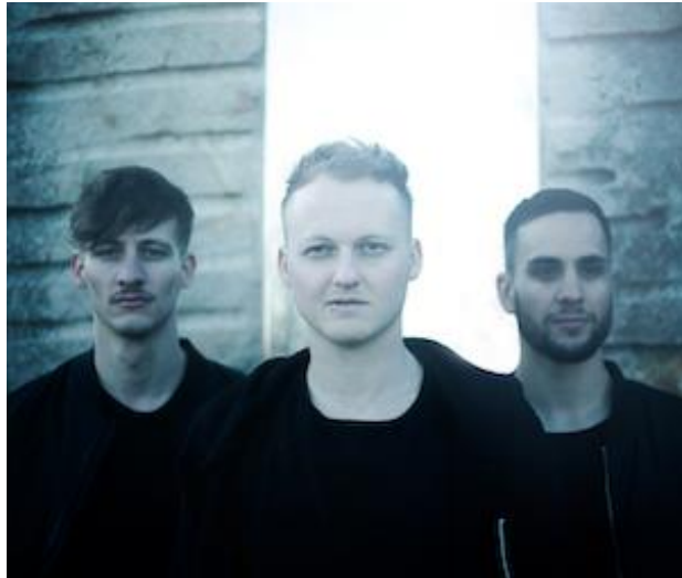
Die österreichische Band SOLARJET.

SOLARJET präsentierten die neue Single bei diversen Gelegenheiten auch live, z.B. in der Sendung „Guten Morgen Österreich“ im ORF und natürlich mit einem Auftritt bei der Matinee „Hellwach“ am 21. September in der Wiener Staatsoper.