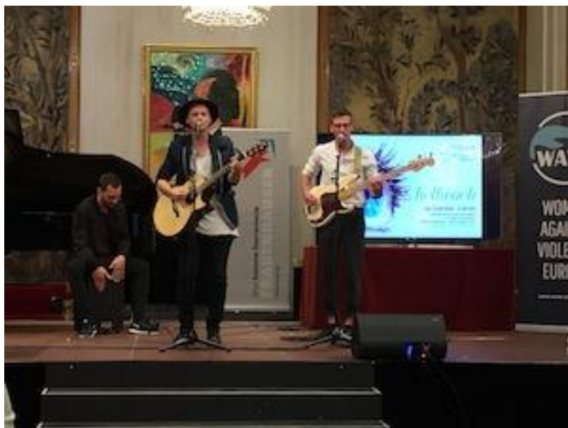
SOLARJET. Foto-Credit: Verein AÖF