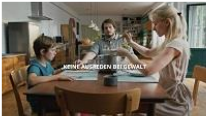
Screenshot aus dem Info-Spot der Frauenhelpline „Keine Ausreden bei Gewalt“.

Patient*innen, die die Praxen aufsuchten, wurden auf diese Weise auf die anonyme 24-Stunden-Hilfe durch die Frauenhelpline gegen Gewalt unter der kostenlosen Nummer 0800 222 555 aufmerksam gemacht.