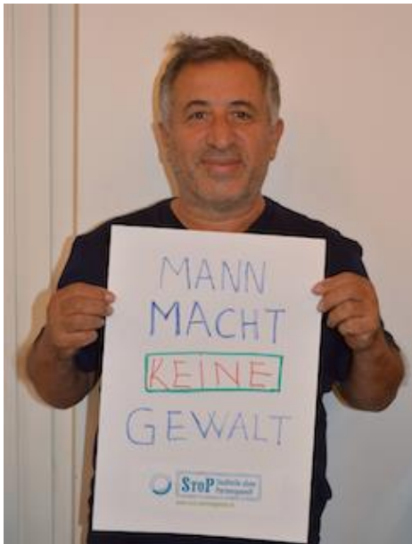
Ein Teilnehmer der StoP-Männertische.