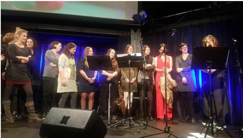
Das Team des Frauenhauses Tirol am Podium.