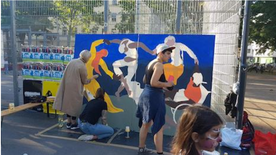
Die Entstehung des StoP -Gemäldes.

Insgesamt nahmen das AÖF-Team und Mitglieder weiterer Projektpartner*innenorganisationen im Jahr 2019 neben den Befragungen in der Nachbarschaft und den Frauen- und Männertischen 102 Vernetzungen und Veranstaltungen im Rahmen des Projekts StoP wahr. Darüber hinaus betreibt das StoP -Team des Vereins AÖF zur breiteren Bekanntmachung des Projekts auch eigene Accounts auf Facebook, Twitter und Instagram – siehe www.facebook.com/StoPMargaretenWien , www.twitter.com/smargareten und www.instagram.com/stopwienmargareten . Aktuell hat StoP 254 „Gefällt mir“-Angaben auf Facebook, 29 Follower*innen auf Twitter und 183 Abonnent*innen auf Instagram.