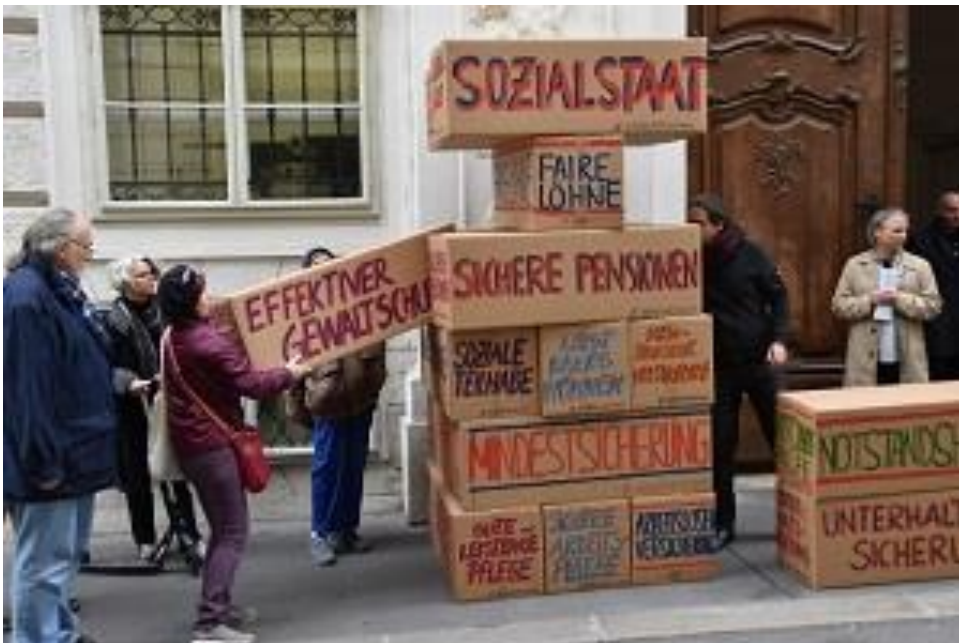
Aktion der Armutskonferenz zum UN-Tag gegen Armut am 17.10.2019 vor dem Winterpalais in Wien.