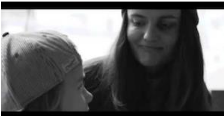
Screenshot aus dem Video zum Song „Hellwach“.