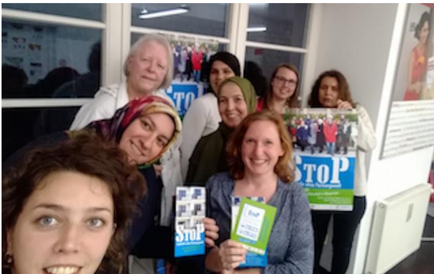
Bei einem StoP -Frauentisch.

Seit Anfang April 2019 treffen sich Nachbarinnen aus dem Bezirk Margareten zweiwöchentlich und machen sich gemeinsam für Zivilcourage und ein gewaltfreies Margareten stark. In gemütlicher Atmosphäre erfolgt ein Austausch über das Thema Partnergewalt und Wünsche für den Bezirk. Die Teilnehmerinnen vertiefen ihr Wissen und planen Aktionen im Bezirk (z.B. Infotische). Regelmäßig stießen im Laufe des Jahres neue Teilnehmerinnen aller Altersgruppen und Herkünfte hinzu und brachten ihre Ideen ein. Die Frauentische fanden im Jahr 2019 jeden zweiten Montag im Monat von 17 bis 20 Uhr im wohnpartner -Lokal im Reumannhof statt. Es nahmen insgesamt 86 Teilnehmerinnen an den 19 Gesprächsrunden 2019 teil.