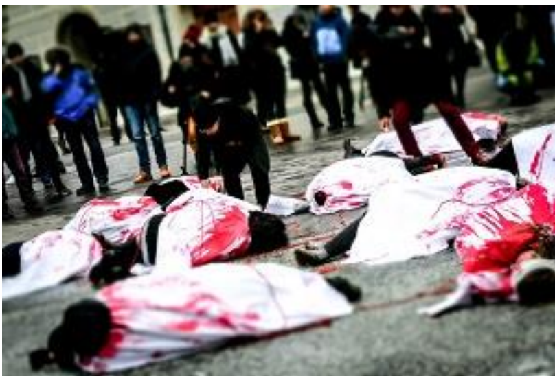
Aktion der Allianz GewaltFREI leben mit OBRA – One Billion Rising Austria und dem Frauen*Volksbegehren am Minoritenplatz.

Darüber hinaus nahm die Allianz GewaltFREI leben regelmäßig mittels Presseaussendungen und Statements auf Social Media (Facebook und Twitter) Stellung zu aktuellen politischen Maßnahmen betreffend Gewaltschutz und Gleichstellung in Österreich, wie z.B. zum Entwurf des neuen Sozialhilfe-Grundsatzgesetz und den Gesetzesänderungen im Gewaltschutzbereich durch die ÖVP-FPÖ-Regierung, zum – vorhandenen sowie notwendigen – Budget für Gewaltschutz und Gewaltprävention und gegen die massive Einschränkung des Zugangs zum Schwangerschaftsabbruch in Österreich sowie gegen die Einschränkung des Bestimmungsrechts von Frauen über ihren eignen Körper durch die Bürger*inneninitiative „FAIRändern“.