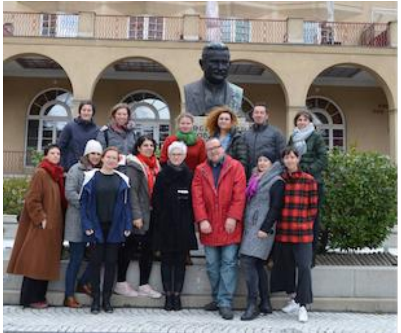
Das StoP-Projektteam.

Der Verein AÖF – Autonome Österreichische Frauenhäuser führt seit Beginn des Jahres 2019 das Nachbarschaftsprojekt „ StoP – Stadtteile ohne Partnergewalt“ im 5. Wiener Gemeindebezirk Margareten durch. Ziel des Projekts ist es, häusliche Gewalt, Partnergewalt und schwere Gewalt an Frauen und Kindern zu verhindern.