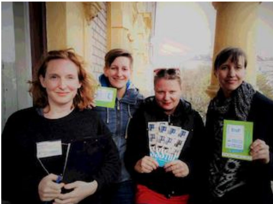
Ein Teil des StoP -Kernteam.

In Rahmen des Projekts StoP sollen gute Nachbarschaften entwickelt werden, um häusliche Gewalt, Partnergewalt und schwere Gewalt an Frauen und Kindern zu verhindern. Nachbar*innen sollen ermutigt werden, Gewalt nicht zu verschweigen und zu dulden. Sie sollen lernen (besser) hinzuschauen und fundiertes Wissen erhalten, was sie bei Verdacht auf Partnergewalt tun können und wie sie sich selber schützen und Positives bewirken können. StoP soll Bewusstseinsbildung und Sensibilisierung leisten und dazu beitragen klare Haltungen gegen (häusliche) Gewalt/Partnergewalt zu entwickeln. Durch das Bekanntmachen von Unterstützungsmöglichkeiten will StoP Bewohner*innen darin bestärken, Hilfe zu holen und/oder zu geben und aufzuzeigen, wie eine gute Nachbarschaft Schutz vor Gewalt bieten kann.