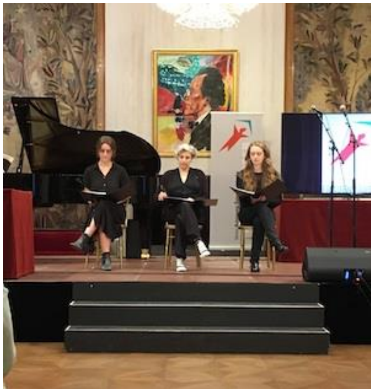
Szenische Lesung mit Schauspielerinnen des Jungen Volkstheaters.